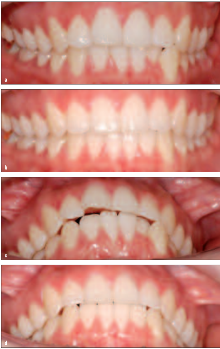
Abb. 1a–d: Frontalaufnahme sowie Overjet vor der Behandlung (a, c) und nach erfolgter Therapie (b, d).