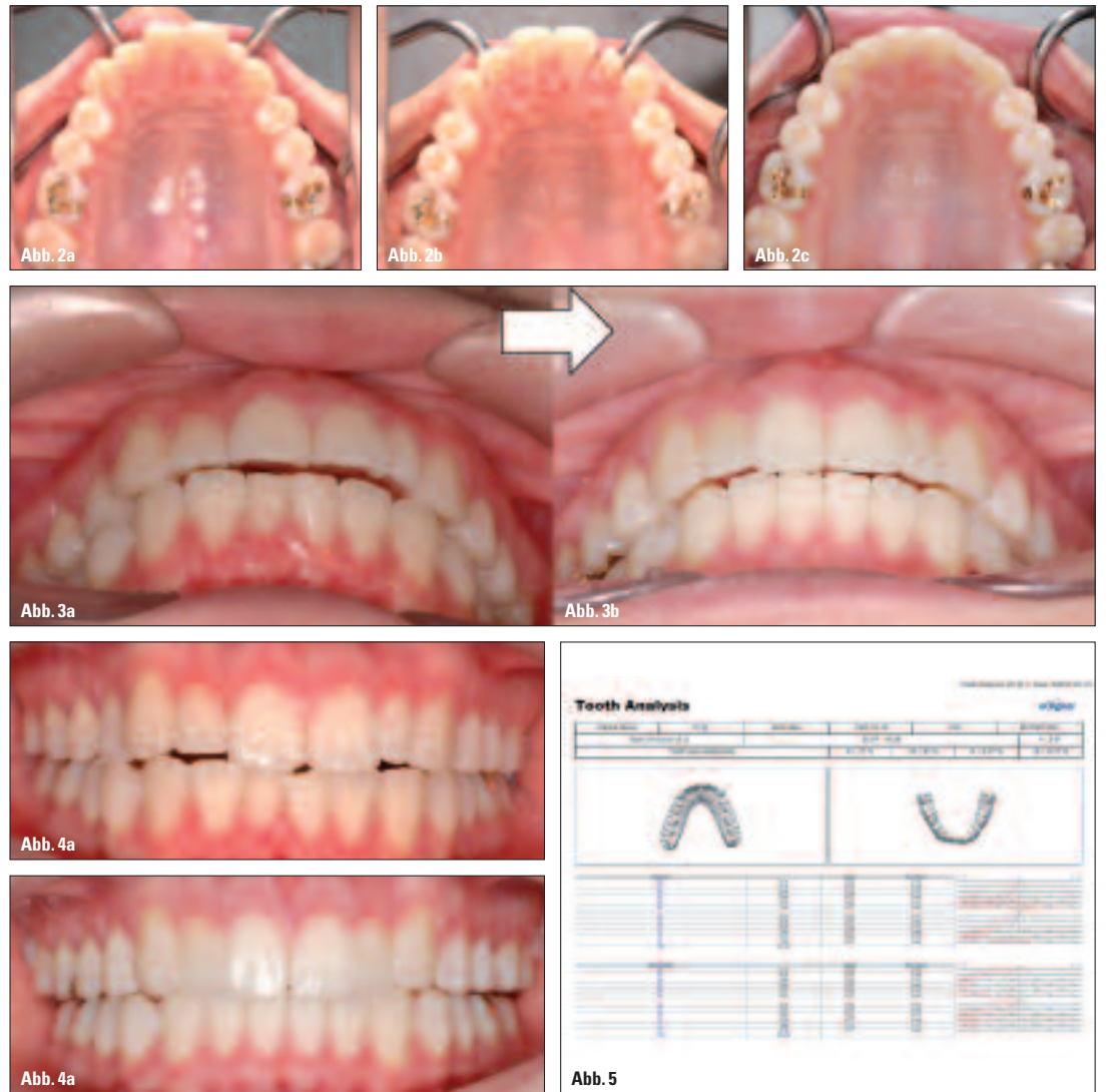
Abb. 2a–c: Vor Behandlungsbeginn (a); gewonnener Platz (b); Komposit, das im finalen Behandlungsschritt eingesetzt wurde (c). – Abb. 3a, b: Overjet vor (a) und nach der Behandlung (b). – Abb. 4a, b: Frontalaufnahmen vor (a) und nach erfolgter Behandlung (b). – Abb. 5: Tabelle zur Ermittlung der Zahngrößen.

Im klinischen Praxisalltag sind Fälle mit Mittellinienverschiebung sehr häufig zu beobachten. So zieht eine Abweichung der Mittellinie von mehr als 2 mm bereits eine von verschiedenen Behandlungsoptionen nach sich. Um z. B. eine gleichzeitige laterale Klasse II- und posteriore Klasse