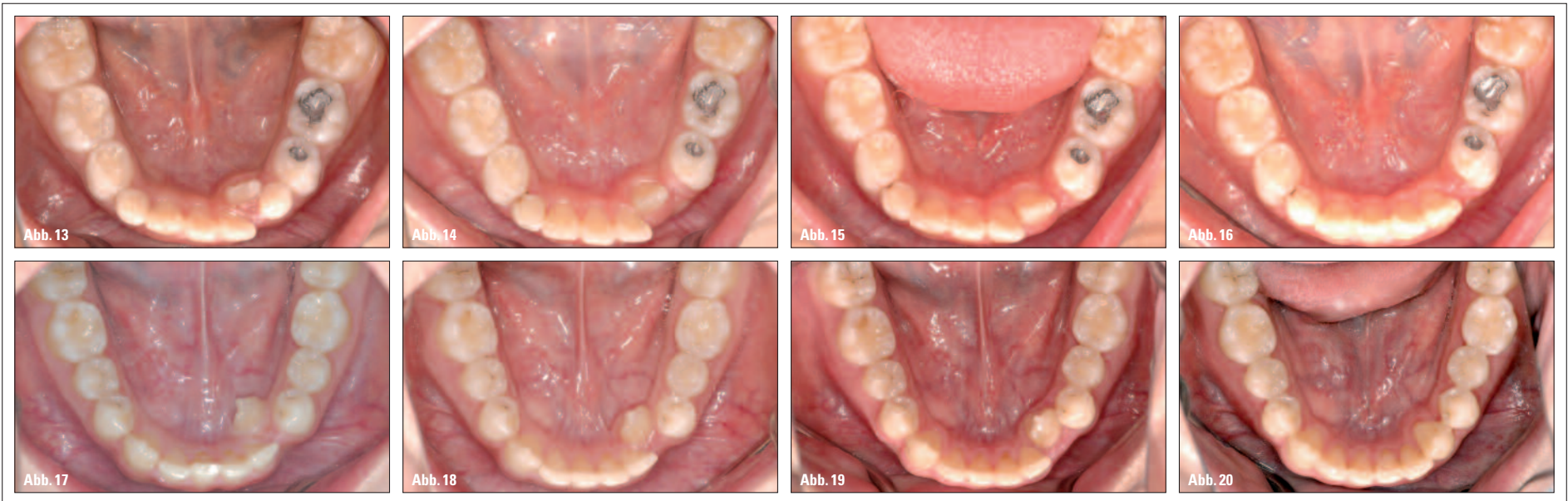
Abb. 13 bis 16: Achtjährige Mädchen mit verlagert durchbrechendem unteren linken lateralen Schneidezahn (Abb. 13: vorher). eCligner® Anwendung (Abb. 14, 15). Nach sechs Monaten ist der linke laterale Schneidezahn ideal im Zahnbogen positioniert (Abb. 16). – Abb. 17 bis 20: 14-jähriger Junge mit linkem ektopischem Eckzahn im Unterkiefer (Abb. 17: vorher). eCligner® wurde ausschließlich im Schlaf angewendet (Abb. 18, 19). Der linke Eckzahn wurde durch Korrektur des Eruptionspfades ohne festsitzende Apparatur oder das Einhängen von Gummizügen korrigiert. eCligner® erweist sich als effektiv bei der Korrektur ektopisch durchgebrochener Zähne (Bloc-out-Technik) bei alleiniger Anwendung über Nacht (Abb. 20).

senden Patienten hingegen wird empfohlen, alle sechs Monate einen neuen Abdruck zu nehmen (in der aktiven Durchbruchphase aller drei Monate). eCligner® verfügt über abgerundete Enden, ist kompakt und ohne scharfe Kanten. Die Aligner können von den jungen Patienten ganz einfach während des Schlafs eingesetzt werden (Abb. 6).