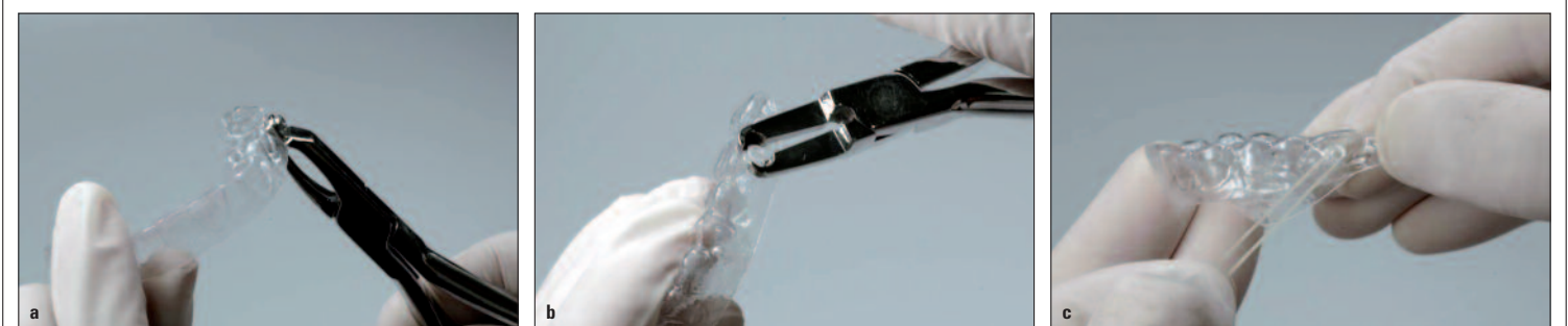
Abb. 29a-c: Für die Anwendung von Klasse II- und III-Gummizügen sind Zangen für die Herstellung von Knöpfchen erhältlich, sodass diese sofort chairside am Aligner eingebracht werden können.