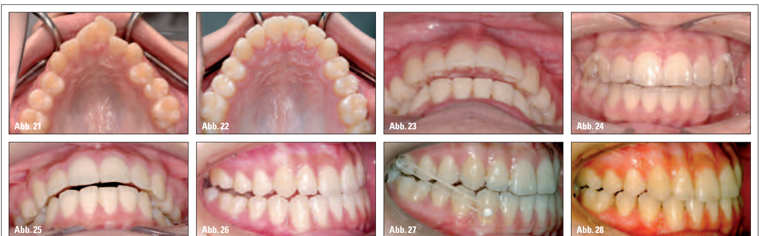
Abb. 21, 22: 13-jähriger Jugendlicher mit enger Bogenform und anteriorem Engstand (Abb. 21: vorher). Um eine spätere Extraktion im Erwachsenenalter zu vermeiden, wurde eCligner® bereits frühzeitig eingesetzt. So konnten Wachstumsgrad und Richtung im Schlaf kontrolliert werden, um eine Klasse II-Wachstumstendenz zu korrigieren. Es wurden ideale Ergebnisse erzielt (Abb. 22: vier Jahre später). – Abb. 23 bis 25: 14-jähriges Mädchen mit Klasse II-Tendenz-Relapse und ausgeprägtem Overjet nach kieferorthopädischer Behandlung vor vier Jahren (Abb. 23: vorher). Der Behandlungsplan sah den Einsatz von Klasse II-Gummizügen an beiden Seiten der verwendeten eCligner®-Retainer vor, um den Klasse II-Relapse zu korrigieren (Abb. 24). Nach dreimonatiger, ausschließlich im Schlaf erfolgter Anwendung reduzierte sich der Overjet deutlich (Abb. 25). – Abb. 26 bis 28: 16-jähriges Mädchen mit Neigung zum Klasse III-Relapse nach kieferorthopädischer Behandlung vor einem Jahr. Außerdem wurden eine gestörte Okklusion im posterioren Segment und sowie Überbiss aufgrund von Schluck-Fehlfunktion im anterioren Bereich festgestellt (Abb. 26). Ein Klasse III-Gummizug wurde in ihre Retainer eingehängt, um die skelettale Klasse III-Tendenz mithilfe von ¼ mittlerer intraoraler Gummizüge eingehängt an mittels Zangen eingebrachter Knöpfchen (Abb. 27) zu korrigieren. Nach viermonatiger Anwendung der eCligner® bei acht bis zehn Stunden pro Tag hatte sich die posteriore Okklusion deutlich verbessert, je mehr sich das anteriore Segment veränderte (Abb. 28).